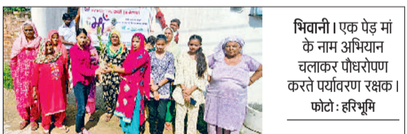
भिवानी। एक पेड़ मां के नाम अभियान चलाकर पौधारोपण करते पर्यावरण रक्षक।

मुख्य कारण लगातार बेरोजगारी का बढ़ना है। सरकार हरियाणा में नशा रोकने व प्रदेश में अपराध पर अंकुश लगाने में विफल सिद्ध हुई है। हरियाणा में हर रोज तीन हत्याएं हो रही हैं। एक साल में हरियाणा में 1020 हत्याएं हुई हैं। हरियाणा में हर रोज 100 से ज्यादा लूटपाट, डकैती, फिरौती व चोरियों की वारदातें होना चिंता जनक है। बजरंग गर्ग ने कहा कि हरियाणा में अपराधियों के भय के कारण शराब के ठेकेदारों ने शराब के ठेकों की बोलियां तक नहीं लगाईं। 12 जिलों में लगभग 328 ठेकों की बोली के लिए ठेकेदार तक सरकार को नहीं मिले जबकि अपराधियों द्वारा जौद, सफौदों, कुरुक्षेत्र व पानीपत में दिन-दिहाड़े शराब ठेकेदारों की हत्या करना चिंता का विषय है।