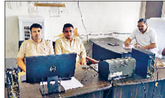
तोशाम। सीईटी परीक्षा को लेकर तोशाम बस अड्डे पर लगाया गया काउंटर।