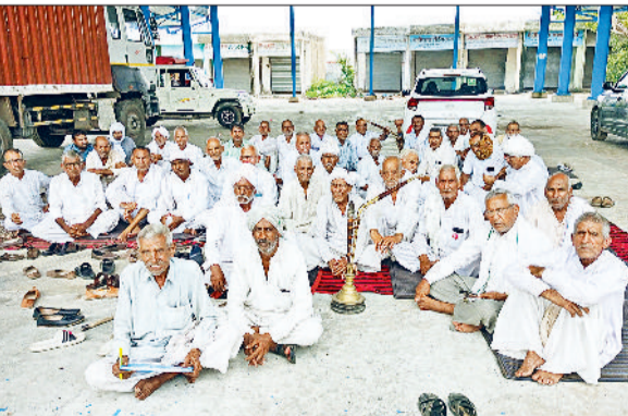
बाढ़ड़ा। धरने पर बैठे किसान।

उन्होंने बताया कि किसानों की मुख्य मांगे खरीब फसल में नुकसान हुआ था जिसे जिला चरखी दादरी के 150 करोड़ की राशि मुआवज्य के रूप में जारी की जानी थी लेकिन बीमा कंपनी के अधिकारी व सरकारी अधिकारी आपस में