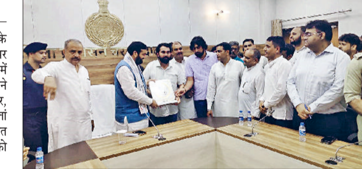
भिवानी। मुख्यमंत्री नायब सिंह सैनी को ज्ञापन देते क्रेशर संचालक।

जिला के स्टोन क्रेशर संचालकों के प्रतिनिधि मंडल ने दादरी आगमन पर मुख्यमंत्री नायब सिंह को रेस्ट हाउस में ज्ञापन सौंपा। ज्ञापन में क्रेशर संचालकों ने बताया कि दादरी जिले के खेड़ी बतर, कलियाणा, अटला कलां, पिचौपा कलां क्रेशर जोन को इंडस्ट्रियल जोन घोषित करने, क्रेशर जोन के सभी रास्तों को डीएमफ से पक्का करने की मांग रखी। माइनिंग विभाग द्वारा ई-रवाना पोर्टल जारी किया है, वह ज्यादातर बंद रहता, जिससे स्टोन क्रेशरों को संचालकों को परेशानी का सामना करना पड़ता है, इसे पको कर दिया जाएगा तो हरियाणा जल प्राधिकरण विभाग द्वारा सभी स्टोन क्रेशरों को जमीन से पानी निकालने के लिए एनओसी लेना अनिवार्य किया गया है। इस एनओसी एक साल की अवधि के लिए ही जारी की जाती है। इस अवधि को कम से कम 5 साल के लिए किया जाए। हरियाणा सरकार के आधिकारिक राजपत्र द्वारा