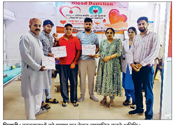
भिवानी। रक्तदाताओं को प्रमाण पत्र देकर सम्मानित करते अतिथि।