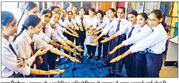
भवानीखड़ा। स्कूल में आयोजित प्रतियोगिता में छात्राओं द्वारा लगाई गई मेहंदी दिखाते हुए।

0सिटी वरिष्ठ माध्यमिक विद्यालय में भारत विकास परिषद