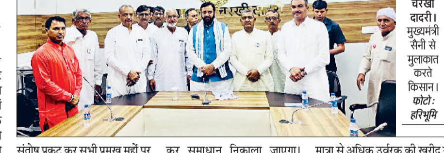
संतोष प्रकट कर सभी प्रमुख मुद्दों पर सहमति जताई। बैठक के दौरान किसानों द्वारा फसलों के बकाया मुआवजे से संबंधित जानकारी साझा की गई, जिस पर मुख्यमंत्री ने आश्वासन दिया कि इस संबंध में शीघ्र ही वरिष्ठ अधिकारियों से मंत्रणा कर समाधान निकाला जाएगा। उन्होंने कहा कि संबंधित वरिष्ठ अधिकारी स्वयं किसान संगठनों से संचालित करवाएंगे। मुख्यमंत्री ने ये भी स्पष्ट किया कि प्रदेश में किसानों के लिए यूरिया और डीएपी की कोई कमी नहीं है, इसलिए आवश्यक मात्रा से अधिक उर्वरक की खरीद न की जाए। उन्होंने कहा कि कई बार किसान आवश्यकता से अधिक उर्वरकों का प्रयोग कर लेते हैं, जिससे खेत की सेहत पर नकारात्मक प्रभाव पड़ता है और इसका असर सभी पर होता है।

मुख्यमंत्री नायब सिंह सैनी ने वीरवार को दादरी स्थित विश्राम गृह में क्षेत्र के किसान संगठनों के प्रतिनिधियों से भेंट की। यह बैठक सकारात्मक वातावरण में सम्पन्न हुई। किसानों ने मुख्यमंत्री का आभार व्यक्त करते हुए कहा कि जहां अधिकांश नेता केवल औपचारिकताएं निभाते हैं, वहीं मुख्यमंत्री श्री नायब सिंह सैनी ने अत्यंत शालीनता के साथ उनकी समस्याएं सुनीं। किसानों ने मुख्यमंत्री से हुई बातचीत के प्रति