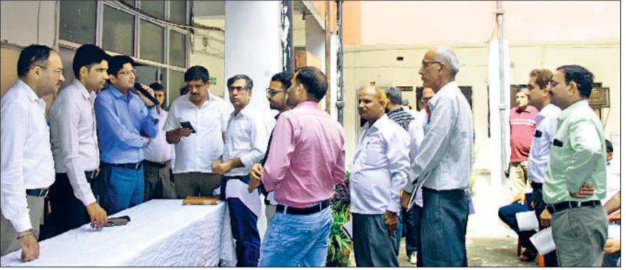
भिवानी। झाई रन के दौरान अधिकारियों को दिशा निर्देश देते हुए।