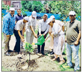
भिवानी। शिक्षा बोर्ड परिसर में पौधारोपित करते हुए।